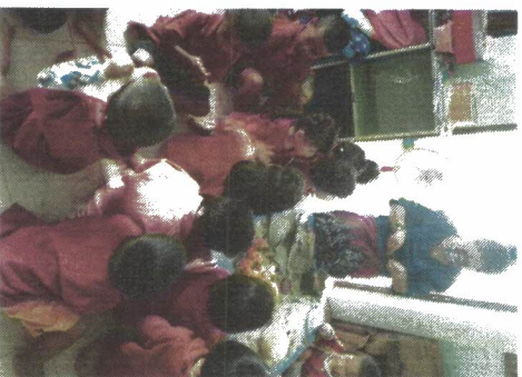
ศูนย์พัฒนาเด็กเล็กบ้านหนองม่วง

สังกัดองค์การบริหารส่วนตำบลเสมีจ อำเภอสำโรงทาบ จังหวัดสุรินทร์